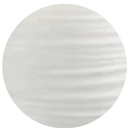
Polyethylene off white