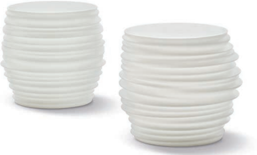
Stool / side table PE, incl. light