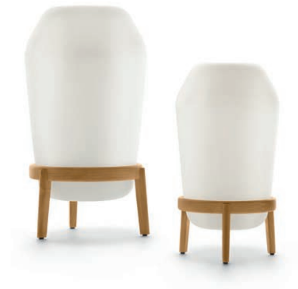
Floor lamp L | Floor lamp S