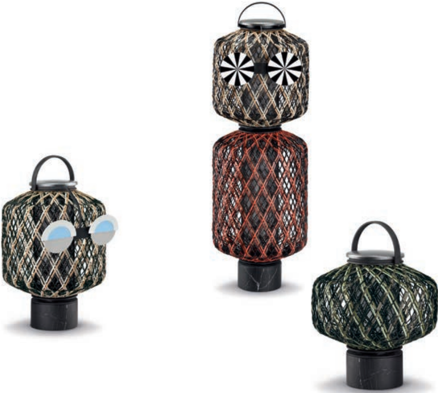
Lantern M, terra + optional set of eyes, midday | Statue LIKA + optional set of eyes, midnight | Lantern S, forest